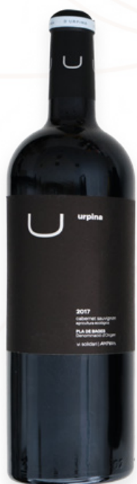
Vi Negre U d'Urpina Ampans