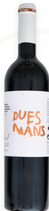
Vi Negre Dues Mans d'Urpina Ampans