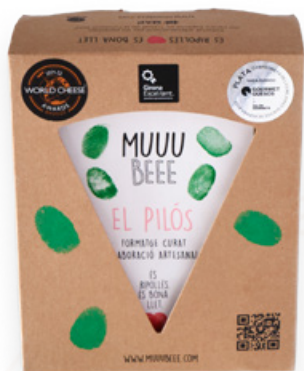
Formatge madurat de vaca El Pilós MUUU BEEE