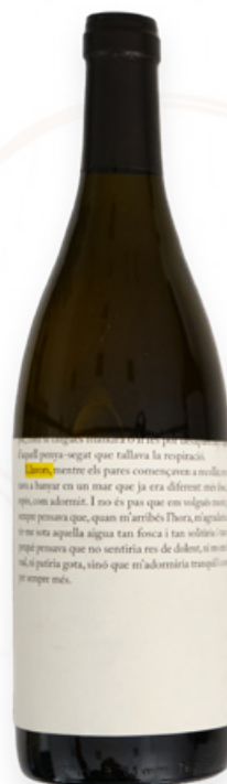
Vi Blanc Llavors La Vinyeta