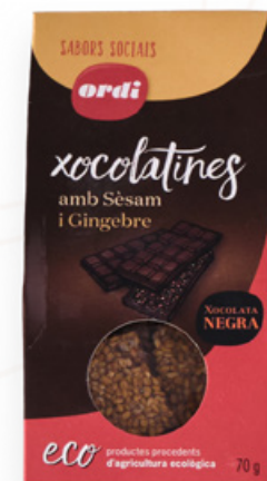
Xocolatines amb sèsam i gingebre 70gr ECO Ordi Natura