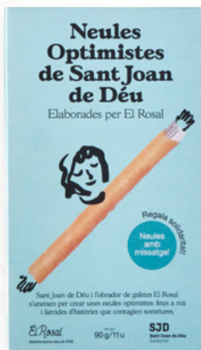
Neules optimistes Sant Joan de Déu & Rosal El Rosal