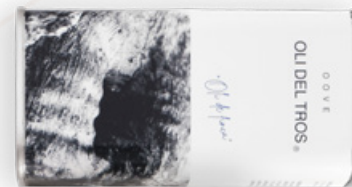
Oli del Tros Terres de l'Ebre 250ml.