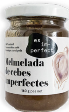
Melmelada Ceba 160g Im-perfect