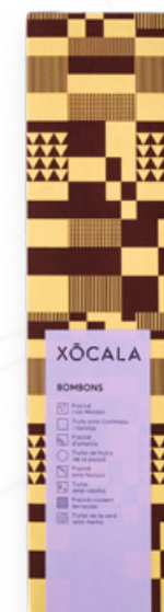
Caixa de bombons (6 unitats) Xócola Hi som