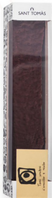
Torró de xocolata, praliné d'ametlles i neules, 200g Sant Tomàs