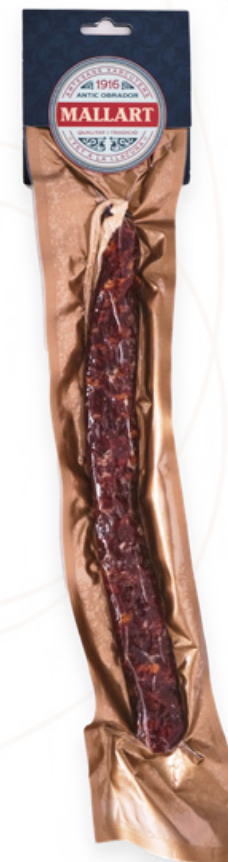
Fuet Extra 190g Mallart