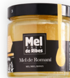
Mel de Romaní de la Vall de Ribes 500g