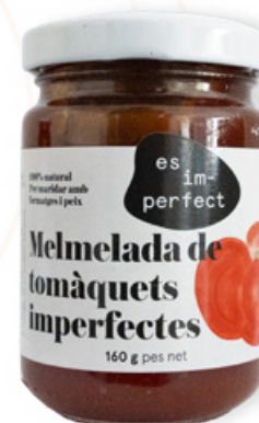
Melmelada Tomàquet 160g Im-perfect