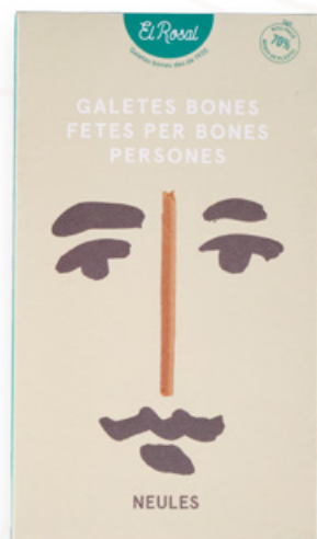
Neules pack col·lecció 140gr (20 galetes) El Rosal