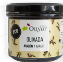
Paté d'oliva d'Aragó 100g Aliments Onyar