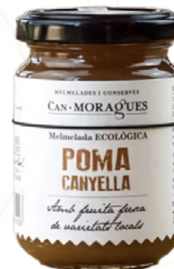
Melmelada de Poma amb canyella 170g Can Moragues