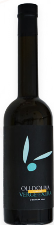
Oli d'Oliva Verge Extra Finques Ampolla 0'5l L'Olivera