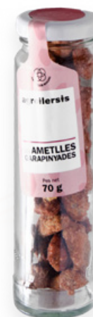
Pot ametlla garrapinyada 70g. Agroilersis