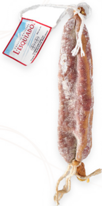
Llonganissa extra al buit. L'Esquiador Ripollès