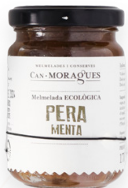
Melmelada de Pera amb Menta 170g Can Moragues