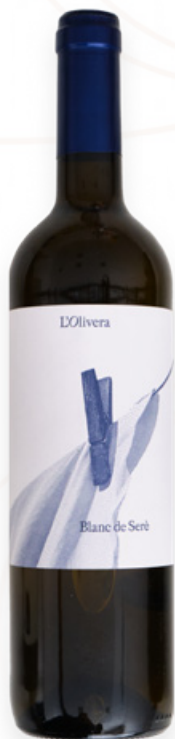
Vi Blanc Blanc de seré L'Olivera