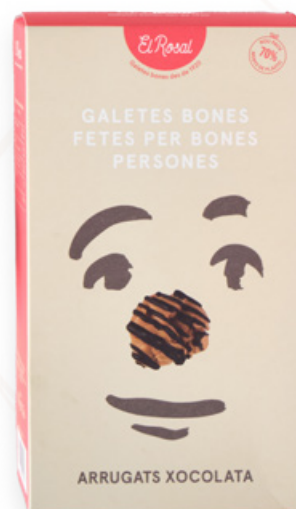
Arrugats xoco pack col·lecció 125gr (15 galetes) El Rosal