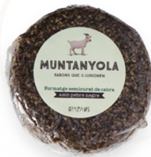
Formatge de cabra semicurat amb pebre negre Muntanyola Ampans