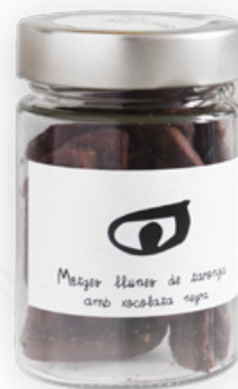
Mitges llunes de taronja amb xoco negra 130g Sant Tomàs