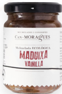
Melmelada de Maduixa amb Vainilla 170g Can Moragues