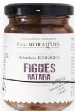
Melmelada de Figs amb Herbes de Ratafia 170g Can Moragues