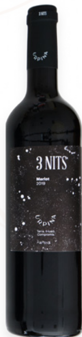
Vi Negre 3 Nits d'Urpina Ampans