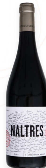
Vi Negre Naltres L'Olivera