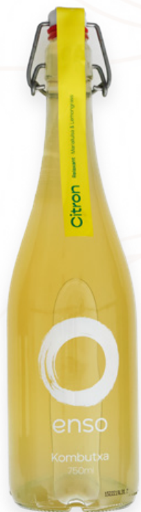
Kombutxa Enso Citron Ampolla 75cl Ferments de Vic