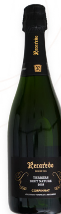
Corpinnat Terrers 2019 Brut Nature llarga criança. Recaredo