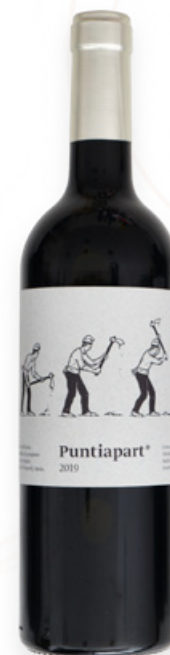
Vi Negre Puntipart La Vinyeta