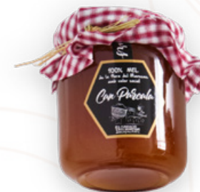
Mel de mil flors 250ml Can Percala Fundació Maresme