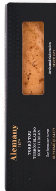
Torró tou 250g Alemany