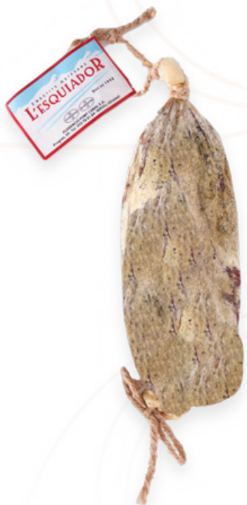
Cap de llom sencer al buit. L'Esquiador Ripollès.