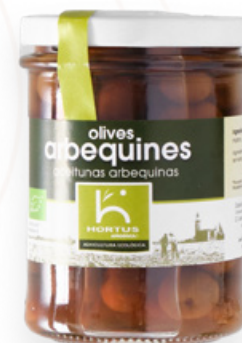
Olives arbequines ecològiques 215g Aprodisca