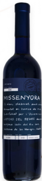
Vi Blanc Missenyora L'Olivera