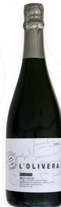
Cava L'Olivera Reserva Brut Nature L'Olivera