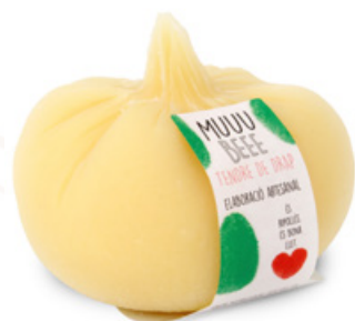
Formatge tendre de vaca Tendre de Drap MUUU BEEE